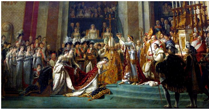
Le sacre de Napoléon Bonaparte